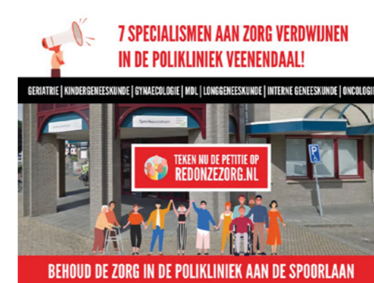
BEHOUD DE ZORG IN DE POLIKLINIEK AAN DE SPOORLAAN